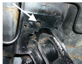
100φ ハス切り シングル出し/左右